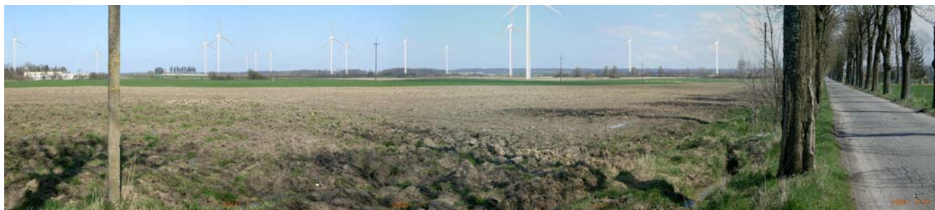
Fot. 4. Widok z drogi powiatowej Nr 0514 Z relacji Wiekowice – Przystawy w kierunku Wiekowa. 11

Z pozostałych miejscowości gminy Darłowo widok będzie w różnym stopniu maskowany wzrastającą odległością, ukształtowaniem terenu oraz zadrzewieniami.