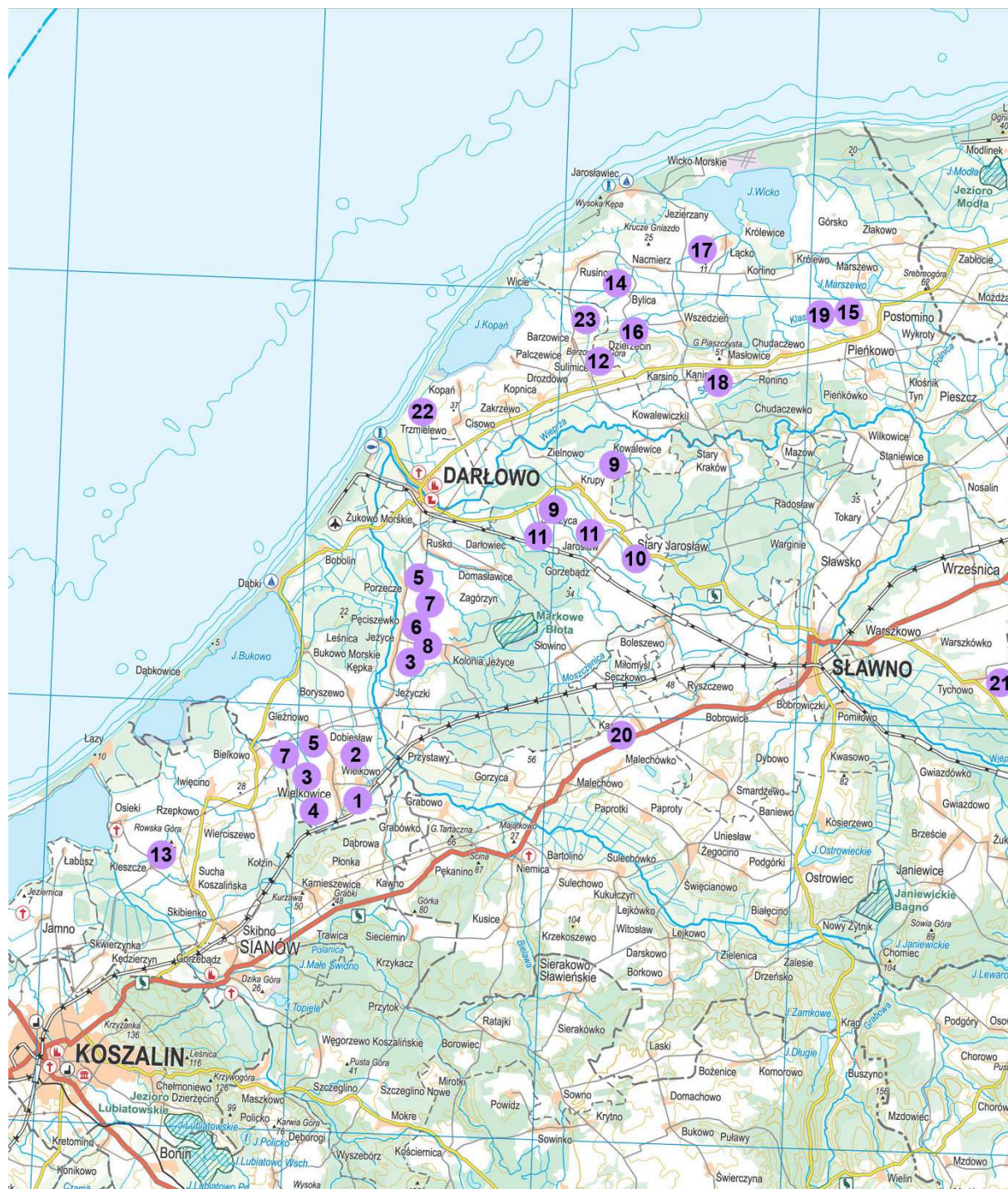
Mapa 3. Rozmieszczenie istniejących i projektowanych farm wiatrowych w sąsiedztwie planowanej inwestycji.