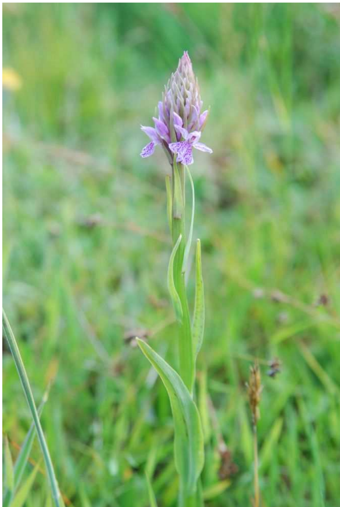
Fot. 11. Stoplamek plamisty Dactylorhiza maculata