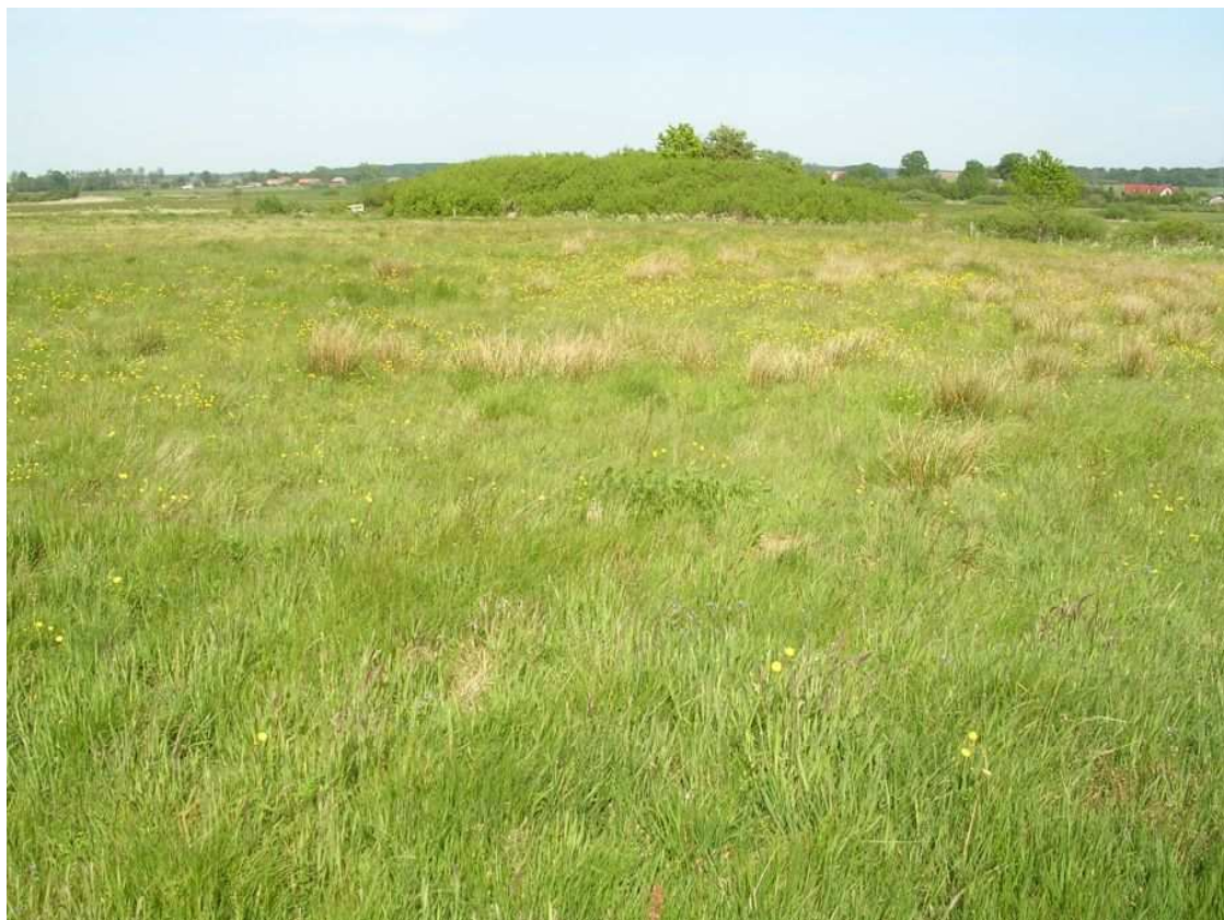
Fot. 14. Rejon planowanej turbiny B17, widok w kierunku zachodnim