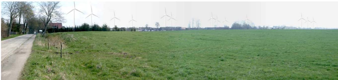
Fot. 4. Wizualizacja elektrowni wiatrowych zlokalizowanych w okolicach miejscowości Dobiesław. Widok w kierunku Dobiesławia z drogi powiatowej Nr 0388 Z relacji Biolkowo - Jeżyczki. 11

Wpływ planowanych elektrowni wiatrowych na krajobraz został szczegółowo zbadany na etapie zmiany studium uwarunkowań i kierunków zagospodarowania przestrzennego gminy, z którego to dokumentu pochodzi powyższa wizualizacja.