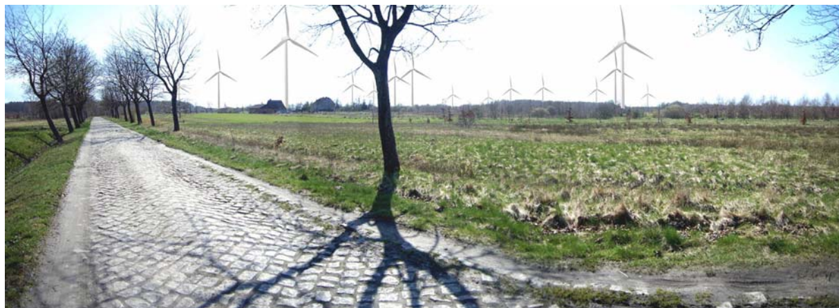
Fot. 4. Wizualizacja farmy wiatrowej w okolicach miejscowości Krupy i Sińczyca. Widok z drogi powiatowej Nr 0502 Z relacji: Krupy – Borzyszkowo w kierunku Borzyszkowa i dalej Krup. Ponad zabudową zagrodową widoczne elektrownie zlokalizowane na zachód od Krup. 11

Z pozostałych miejscowości gminy Darłowo widok będzie w bardzo dużym stopniu maskowany przez kompleksy leśne otaczające inwestycję.