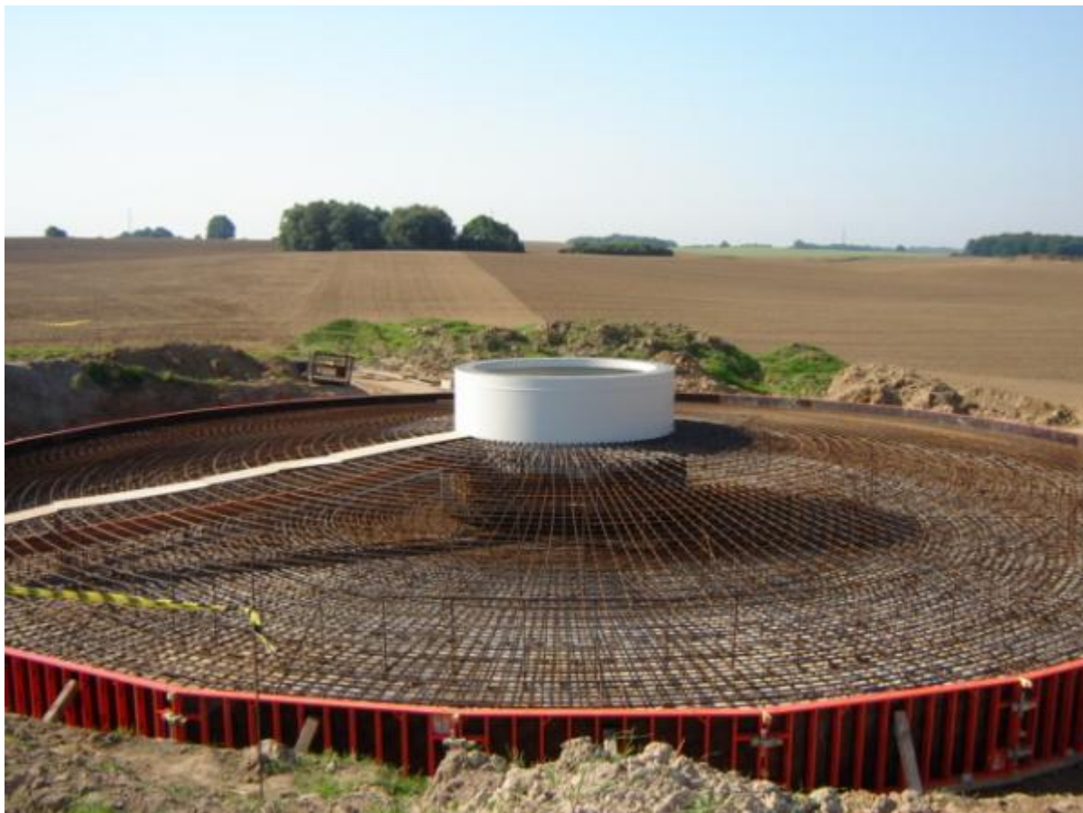
Fot.1. Przykład zbrojenia fundamentu elektrowni wiatrowej (farma wiatrowa w Tymieniu, woj. zachodniopomorskie) 3

Stalowe wieże elektrowni będą miały wysokość 100 m i zostaną zmontowane z gotowych elementów, dostarczonych przez producenta. Wieża będzie mocowana do fundamentu za pomocą stalowego elementu kotwiącego.