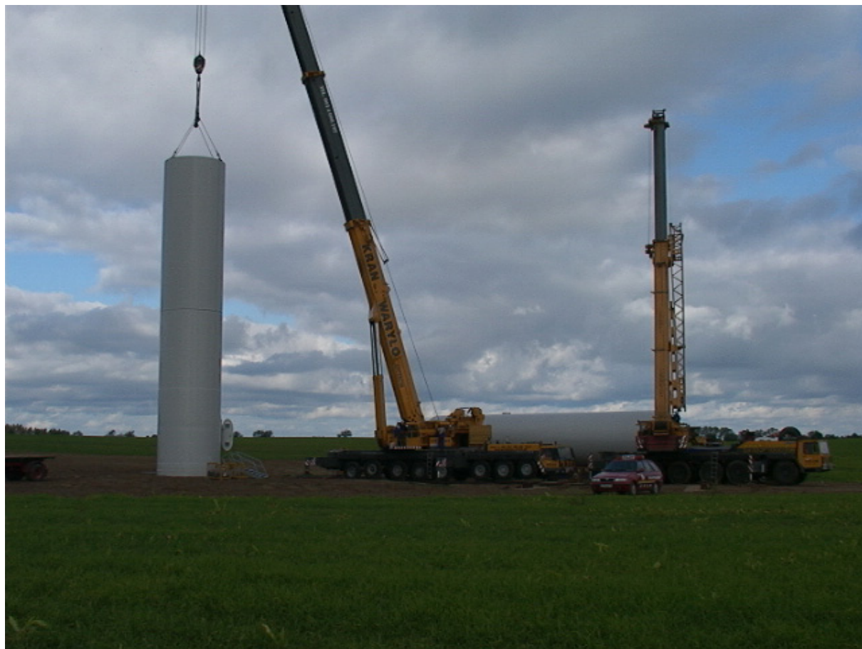
Fot. 2. Montaż wieży elektrowni wiatrowej z gotowych elementów (farma wiatrowa w Tymieniu, woj. zachodniopomorskie). 4

W ramach prac końcowych etapu budowy przewiduje się przywrócenie terenu wokół elektrowni do stanu poprzedniego, m.in. poprzez przysypanie kotwy elektrowni glebą (pochodzącą z wykopów pod fundamenty) i jej zadarnienie.