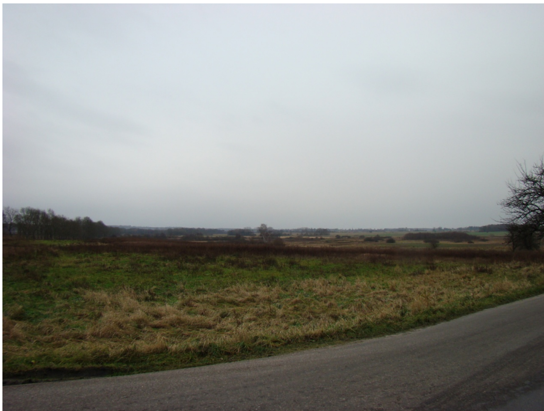
Fot.3. Typowy krajobraz terenu gminy Darłowo

Oddziaływanie pracujących elektrowni wiatrowych na otaczający krajobraz wynika z wizualnej specyfiki samych konstrukcji, fizjografii obszaru inwestycji oraz struktury osadniczej tego regionu.