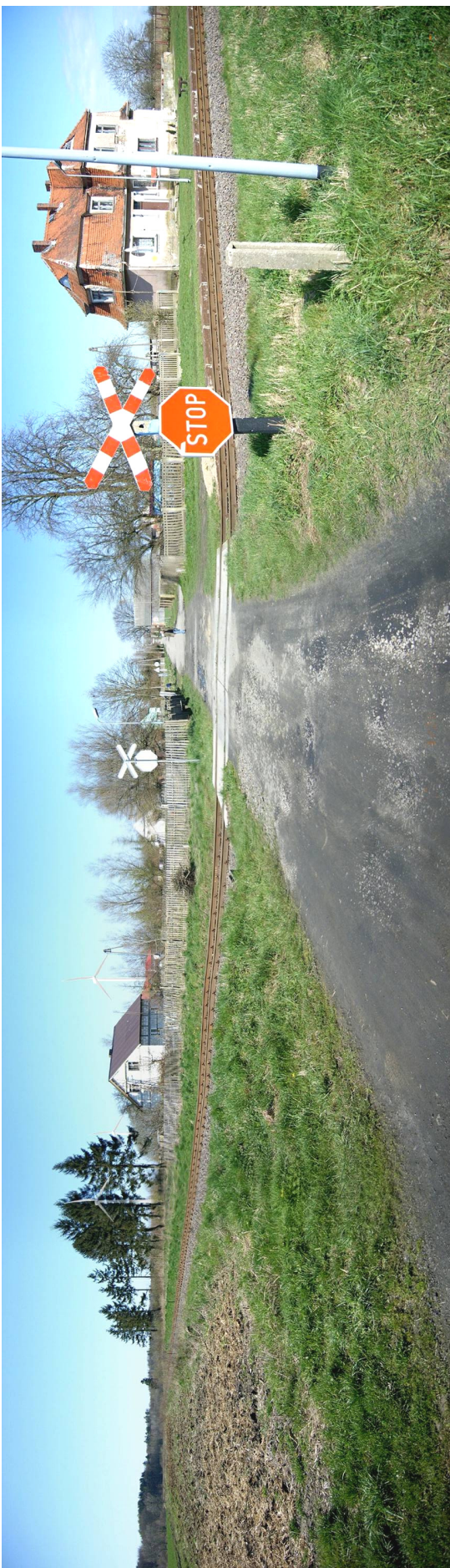
Fot. 3. Wizualizacja elektrowni farmy wiatrowej Nowy Jarosław od południa . Widok z drogi powiatowej Nr 0505 Z relacji: Stary Jarosław – Nowy Jarosław w kierunku Starego Jarosława. Na pierwszym planie linia kolejowa relacji: Sławno – Darłowo i budynek stacji kolejowej w Nowym Jarosławiu. Elektrownie lokalizuje się po obu stronach drogi (FW Nowy Jarosław po lewej, a FW Stary Jarosław po prawej stronie) przy czym ze względu na położenie punktu ekspozycji znaczna ich część pozostaje niewidoczna lub mało widoczna wśród budynków i zieleni je otaczającej. Widoczne w poniższej ekspozycji powiązanie projektowanych elektrowni z zabudową (starą i współczesną) nie powinno stanowić zagrożenia dla wartościowych elementów krajobrazu kulturowego miejscowości i gminy.