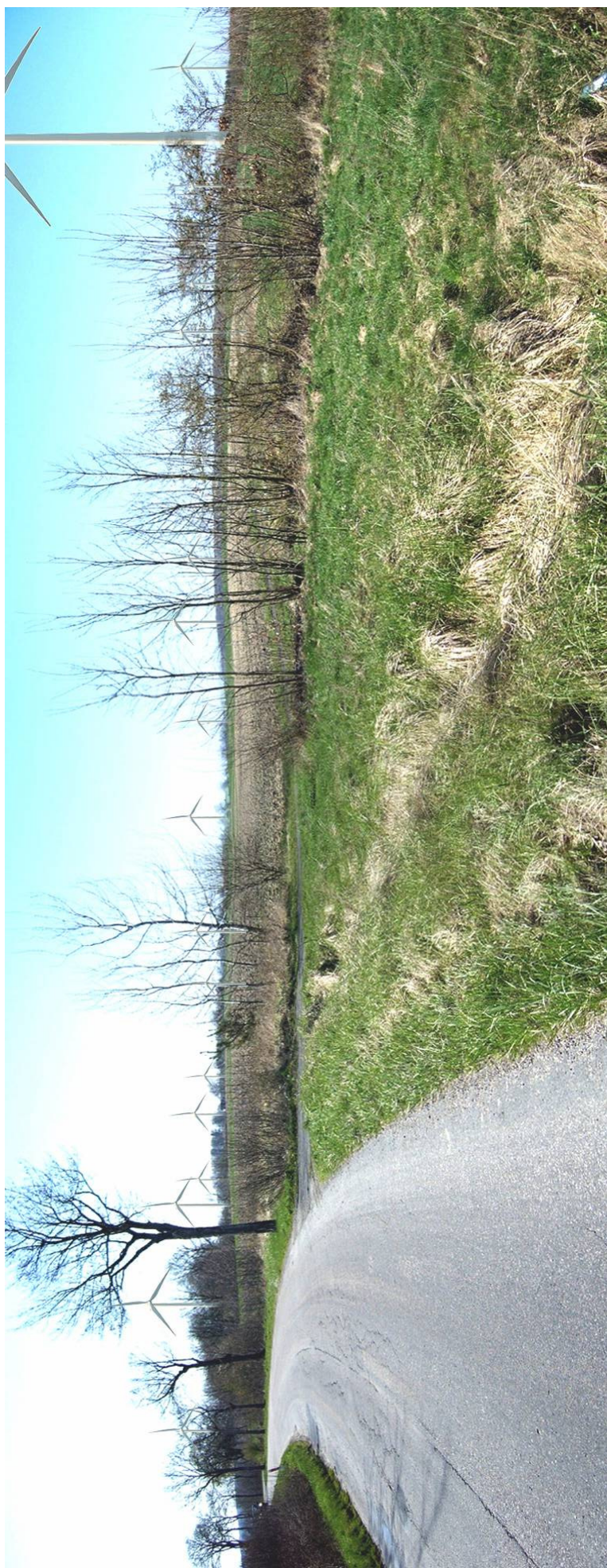
Fot. 4. Wizualizacja elektrowni farm wiatrowych Nowy Jarosław (po lewej stronie) i Stary Jarosław (po prawej stronie) od wschodu . Przykład skumulowanego oddziaływania farm wiatrowych na krajobraz. Widok z drogi wojewódzkiej Nr 205 relacji: Darłowo - Darłowo - Krupy - Sławno - Polanów – Bobolice w kierunku Starego Jarosława (odległość do miejscowości ok. 1 km). Konfiguracja terenu i jego użytkowanie (zieleni śródpolna i przydrożna) skutecznie eliminują powiązania projektowanych elektrowni z elementami krajobrazu kulturowego miejscowości. Sylweta kościoła pozostaje ukryta wśród zieleni wysokiej. Brak widocznych powiązań planowanej inwestycji z wartościowymi elementami krajobrazu kulturowego gminy.