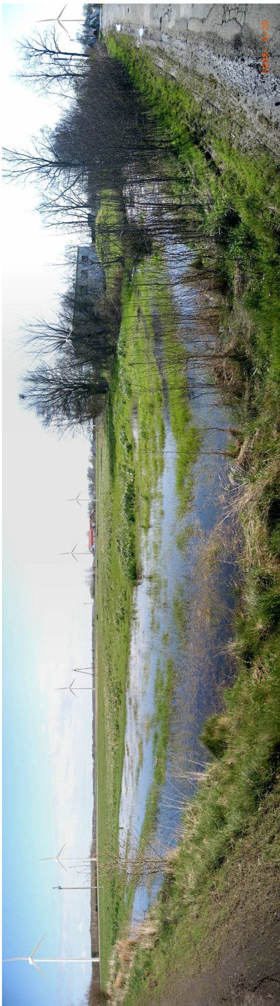
Fot. 2. Wizualizacja farmy wiatrowej Nowy Jarosław (na dalszym planie) oraz części farmy wiatrowej Stary Jarosław (elektrownie na pierwszym planie, po lewej stronie) z północnego wschodu . Widok z drogi powiatowej nr 0503 z relacji Sulimice – Stary Jarosław, w kierunku Starego Jarosława.