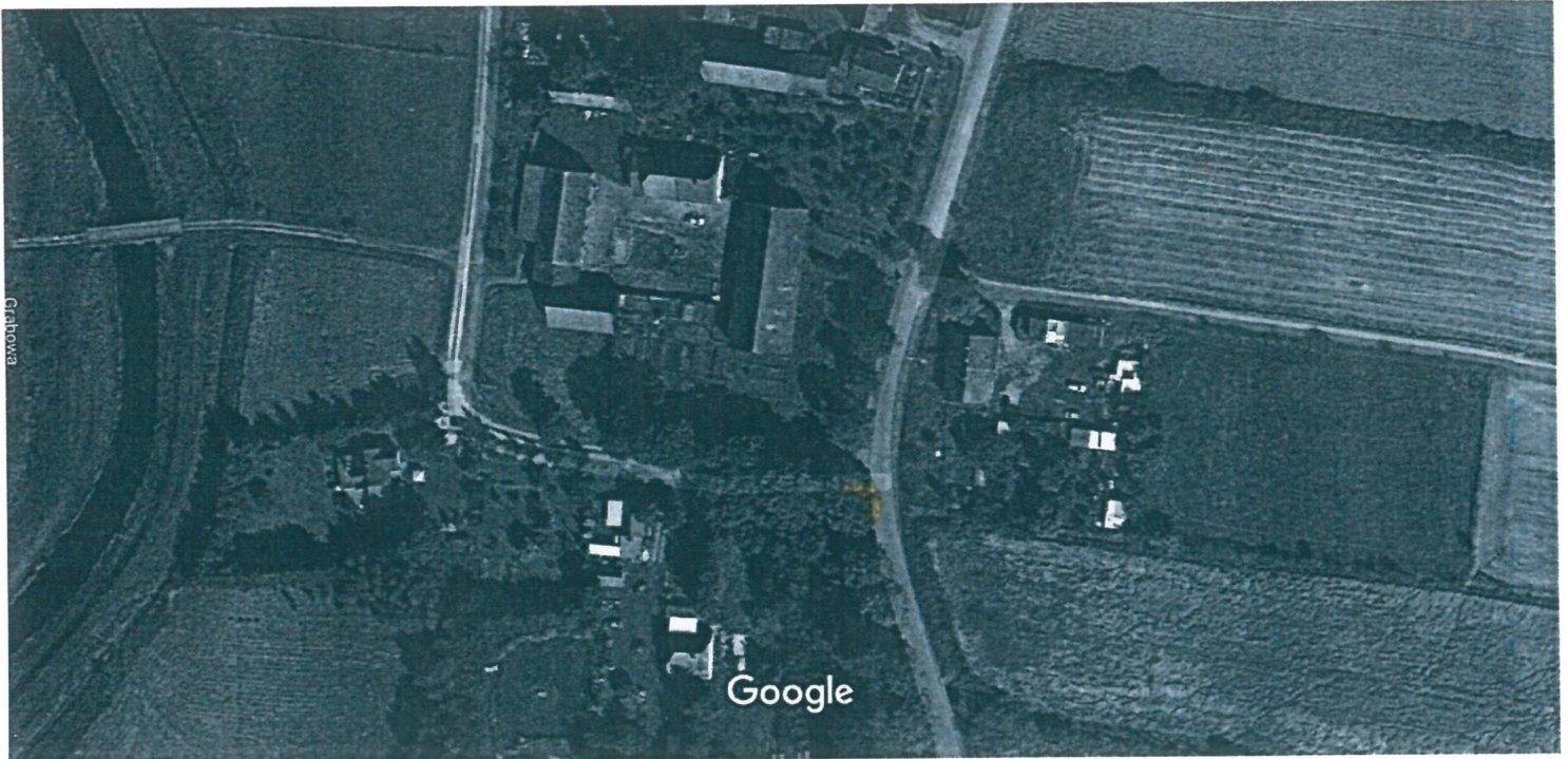
20 m