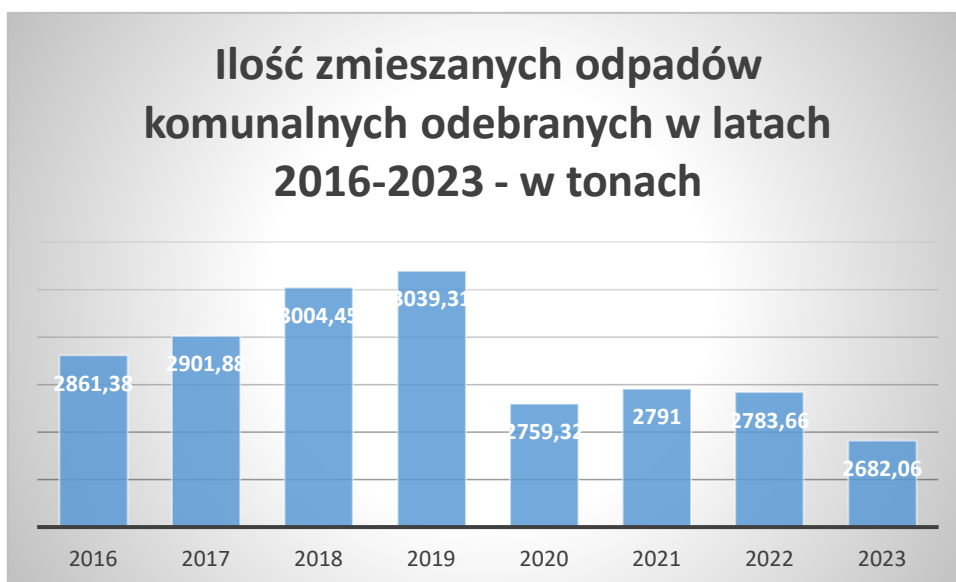
Schemat 2. Ilość zmieszanych odpadów komunalnych odebranych z terenu gminy Darłowo w latach 2016-2023.

Powyższe schematy pokazują tendencję wzrostową dot. ogólnej ilości odpadów na przestrzeni lat 2016-2019, następnie nieznaczny spadek w roku 2020 oraz kolejny wzrost w 2021. Natomiast, w latach 2022 r. i 2023, zanotowano nieznaczny spadek ogólnej ilości odpadów. Ilość zmieszanych odpadów komunalnych odebranych z terenu gminy Darłowo znacząco zmniejszyła się w porównaniu z rokiem 2019, jest niższa nawet od roku 2016. Należy