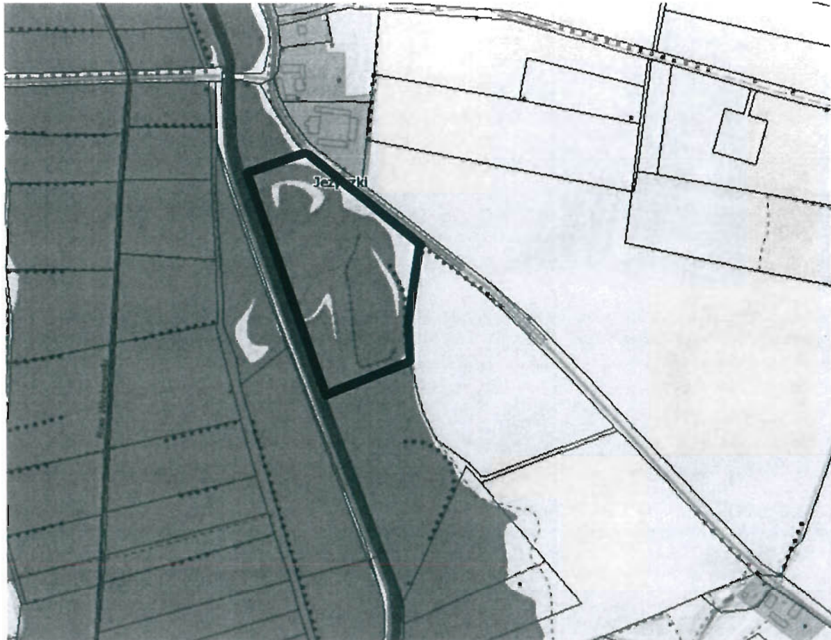
Ryc. 2. Zrzut ekranu przedstawiający zasięg szczególnego zagrożenia powodzią (niebieskie wypełnienie) w granicach działki nr 215, obr. Jeżyczki (czarna obwiednia). Stan na 18 października 2022r.